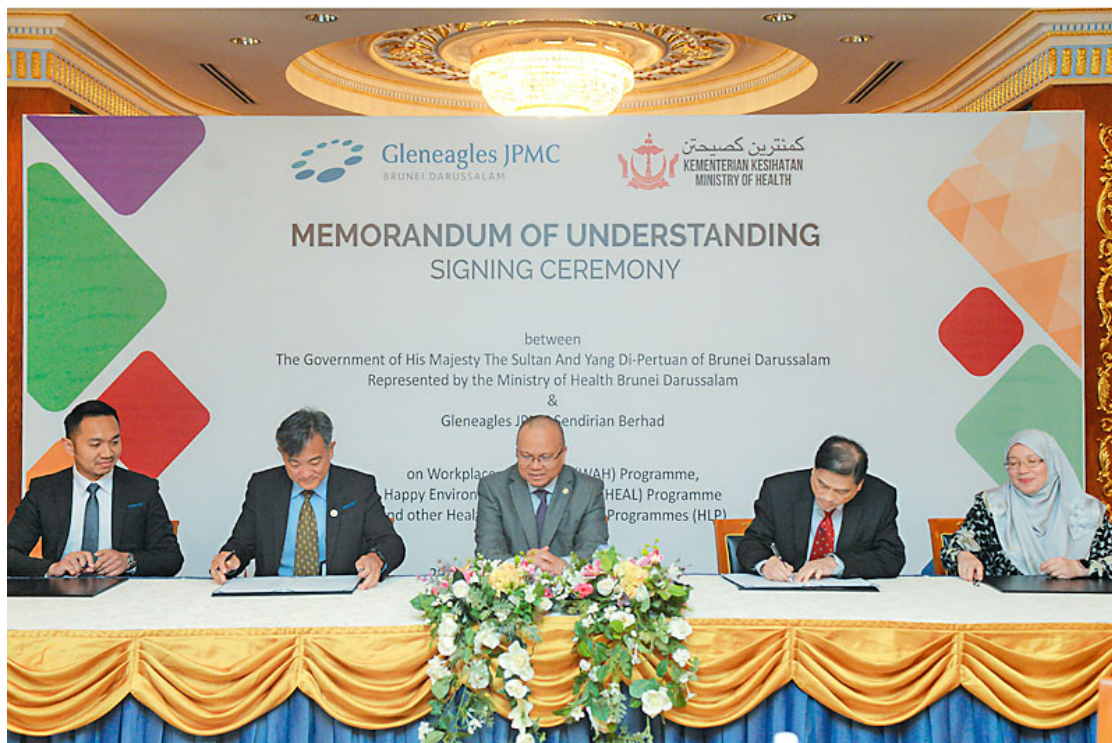
Yang Berhormat Menteri Kesihatan menyaksikan penandatanganan MoU antara Gleneagles JPMC dan Kementerian Kesihatan.